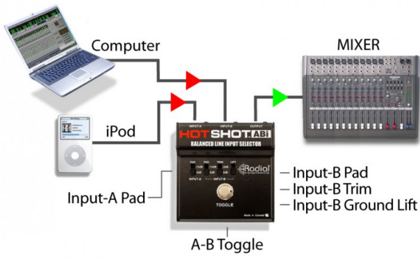
Exemple de setup